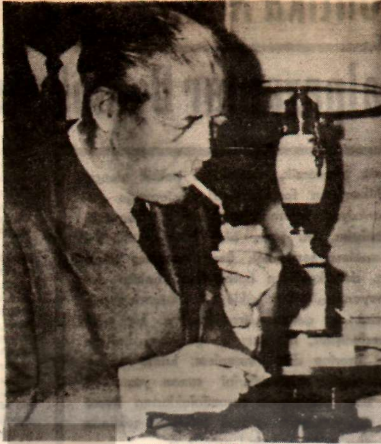
Başbakan Mac Millan Ahi alın Üsküdarı geçti...

Ortak Pazar içinde son durum karşısında ortaya çıkan büyük bir anlaşmazlık var. Batı Almanya da dahil olmak üzere Fransa hariç diğer 5 ortak, İngiltere'nin bir Avrupa Birliği'nin düşündülmeyeceği kanaatinde. Adenauer'in gösterdiği tepkisel olacağı bilinen B. Almanya İktisat Bakanı Erhard: «Bu, Avrupa için kara bir gündür. Ortak Pazar artık bir mekânlmazdır. Yaşayan bir şey değildir» diyor. Diğer ortaklar İngiltere ile görüşmelere yanaşmasını