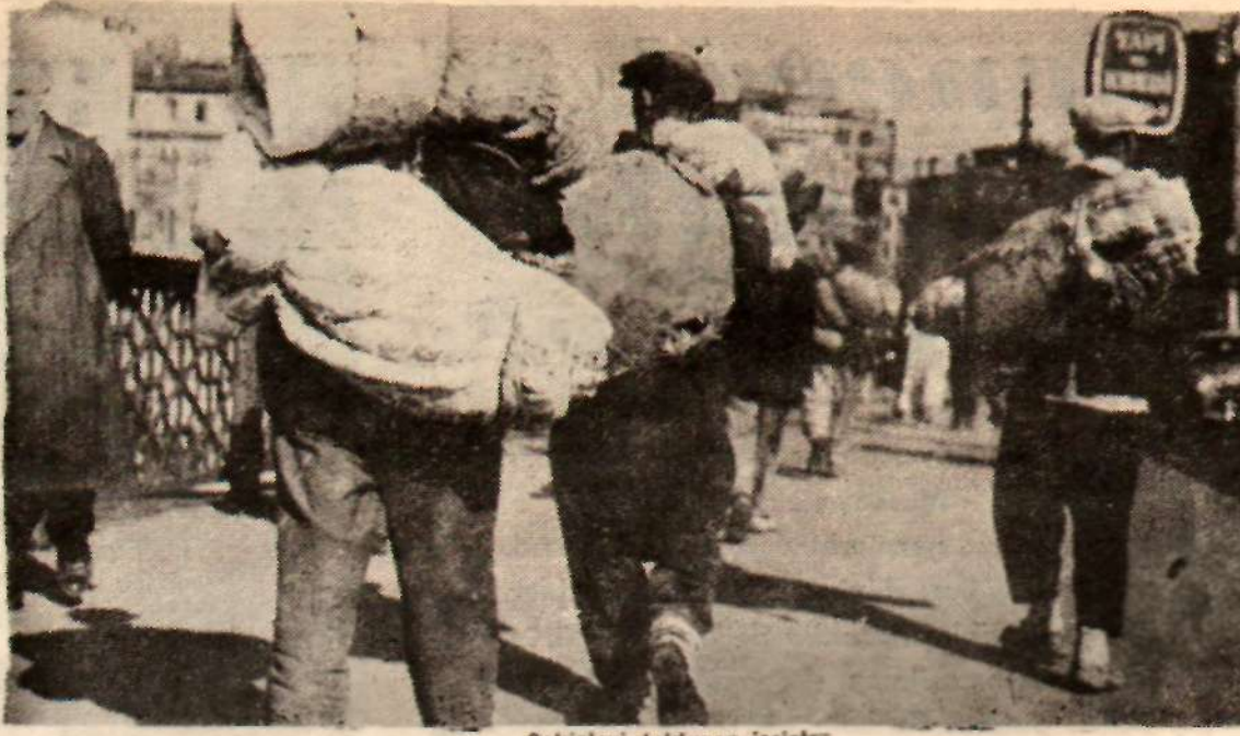
Şehirleri dolduran işsizler

Bir argat kahvesindeyim. Caddede savrulan tipi camlara vuruyor. Kahvenin delik deşik olmuş tava nede kar taneleri döktülüyor. İş sizler toplanmışlar soba başına. Tütün sobanın içine sigaretlerin du manete dolu içecek, bit dumanı de niki gibi. Eller uzanmış sobaya. El ler nazlı eller pengelli pence