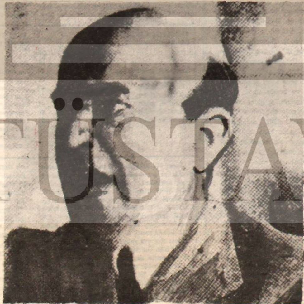
Cavit Bey: «Mullaka yabancı sermaye»

Meşrutiyetin ilânında her kûmet sözde kendi ves Umumiyyeye yazdığı tezlî jimin liberal bir rejim du duyurulmasını istiyor. L venin basında buluş. S bir raporunda şöyle r: Türk köylüsünün hürî masından ve müessif trin sından korkuluvordunca devrim olmadığı te ed. Diiyunu Umumive lü görmeden tehlikeyi t!..